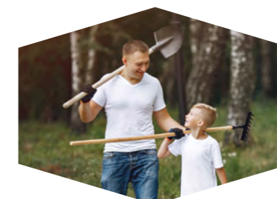
Быть в окружении единомышленников