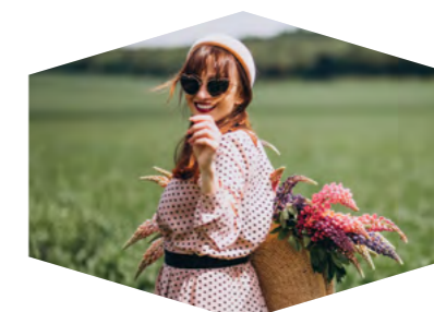
Жить в тишине